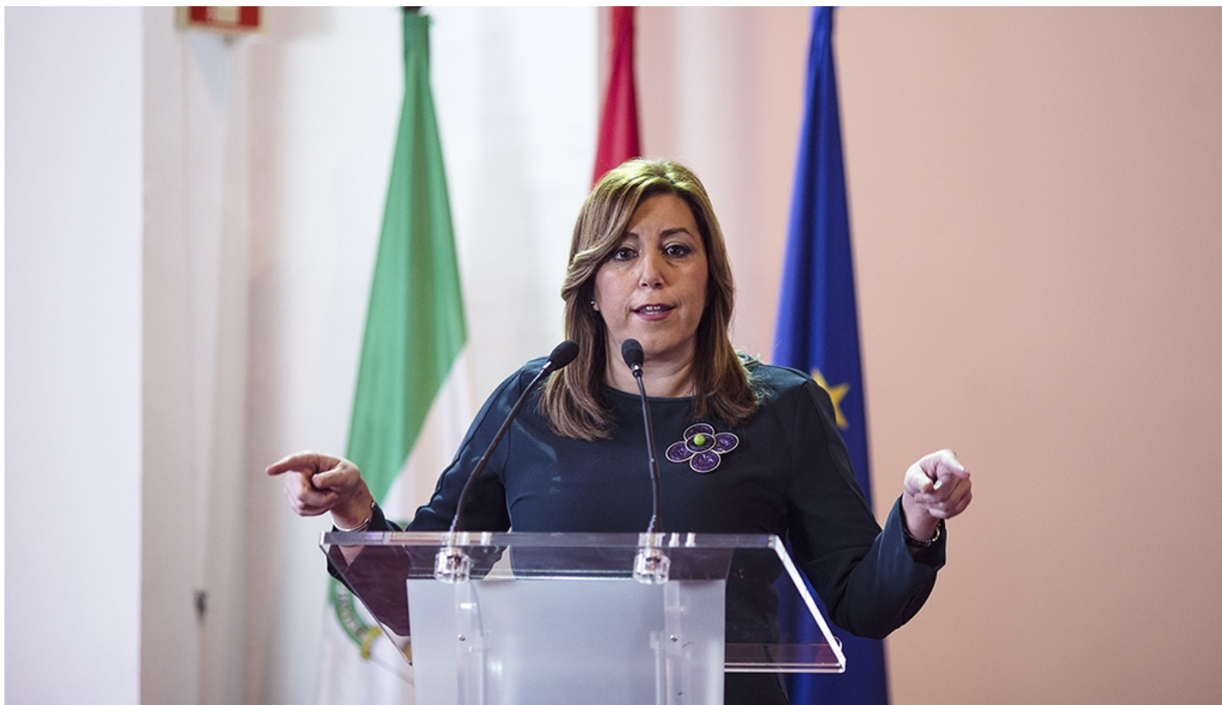
La presidenta de la Junta de Andalucía, Susana Díaz

La presidenta de la Junta, Susana Díaz, ha valorado el crecimiento de la hostelería y el turismo en Andalucía y ha reclamado a los empresarios que creen empleo "digno y de calidad" en este sector. Díaz se ha referido, en su discurso durante la entrega de los títulos académicos de la última promoción de 66 alumnos que han terminado su ciclo formativo en el Hotel Escuela Convento de Santo Domingo en Archidona (Málaga), a los datos de la Encuesta de Población Activa del cuarto trimestre, que apuntan a que Andalucía logró un descenso del desempleo en 78.000 personas en el último año y hasta 340.000 en el último trienio.