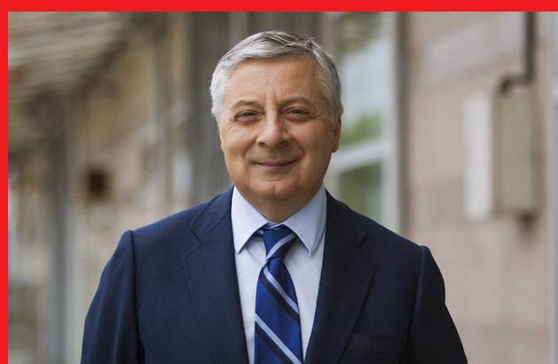
El eurodiputado socialista José Blanco

El eurodiputado socialista José Blanco ha lamentado la falta de "ambición" del paquete de energía limpia presentado por la Comisión Europea para evitar situaciones de "alta volatilidad de precios" como la que está sufriendo España. Durante su intervención en el debate con el vicepresidente Maroš Šefčovič, el eurodiputado socialista ha remarcado los bajos niveles de satisfacción de