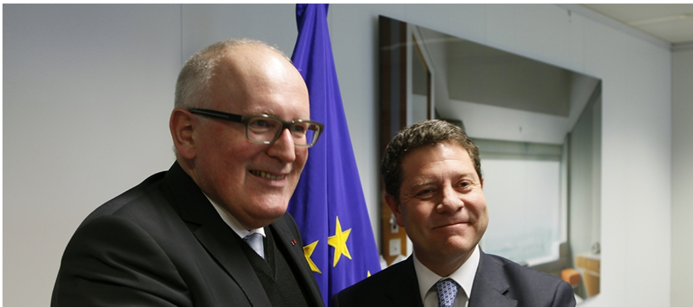
Emiliano García-Page antes del encuentro mantenido con el socialista Frans Timmermans