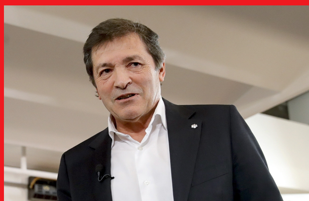
El presidente de la Comisión Gestora del PSOE, Javier Fernández

Diputado socialista por Málaga en el Congreso de los Diputados