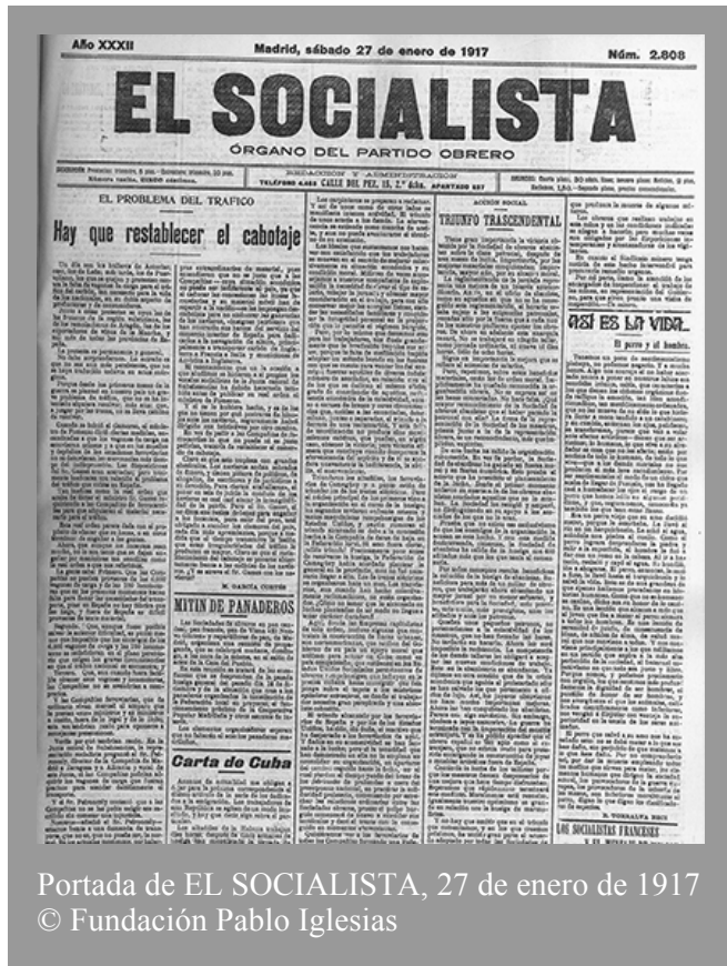
Portada de EL SOCIALISTA, 27 de enero de 1917