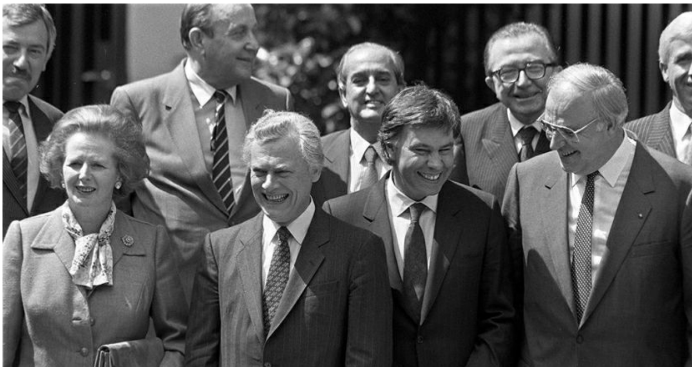
Felipe González en la segunda jornada de la Cumbre de la Comunidad Económica Europea, 1985