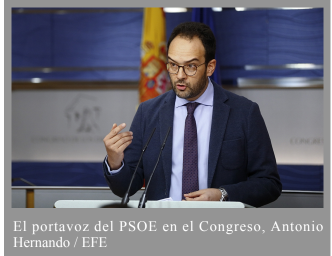
El portavoz del PSOE en el Congreso, Antonio Hernando

El portavoz del Grupo Socialista, Antonio Hernando, ha explicado que de cara a la sesión de control al Gobierno en el Pleno de la semana que viene, las preguntas versarán sobre temas de actualidad y problemas preocupantes, como el precio de la luz o de la energía. "Parece sorprendente que Rajoy haya actuado más como hombre del tiempo que como presidente del Gobierno" en esta