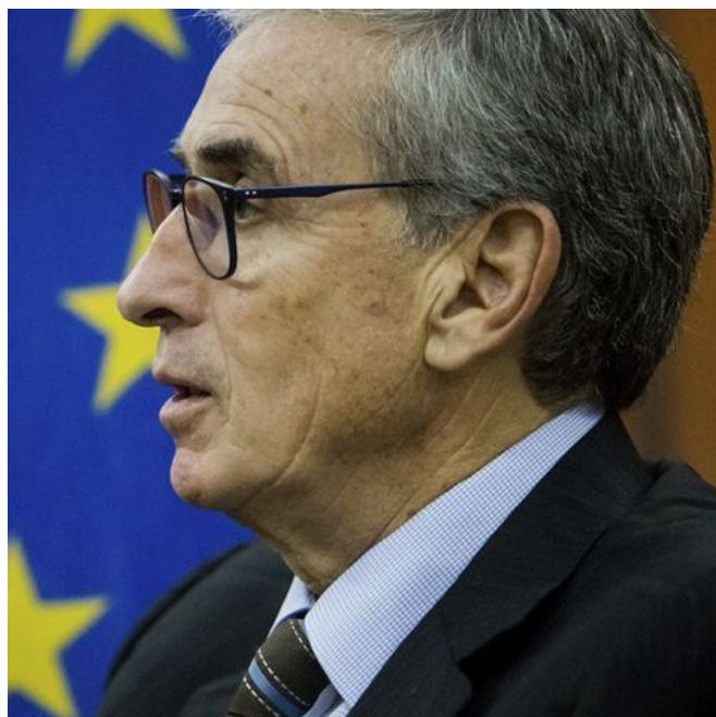
Ramón Jáuregui