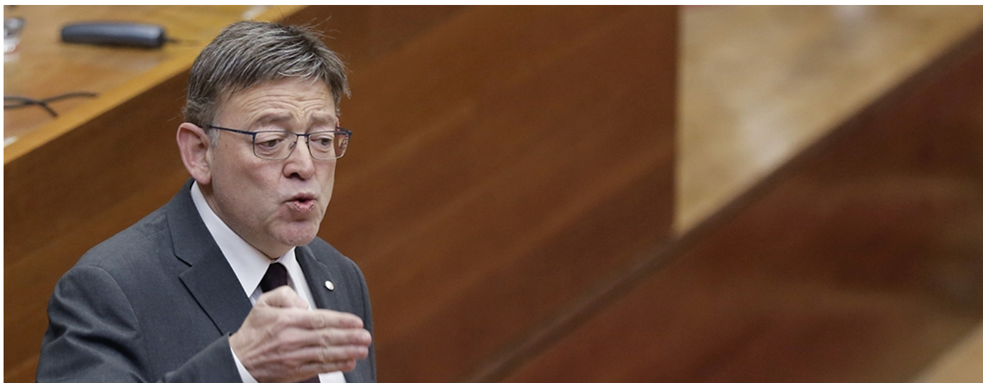
El president de la Generalitat, Ximo Puig